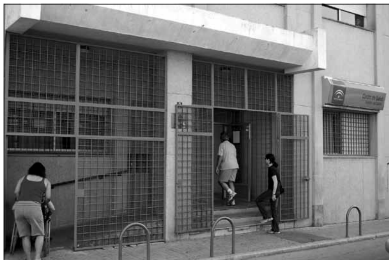
Fig. 1. Entrada a un Centro de Salud. (Para una mejor apreciación, consultar esta foto en color en el atlas fotográfico que encontrará al final del manual).