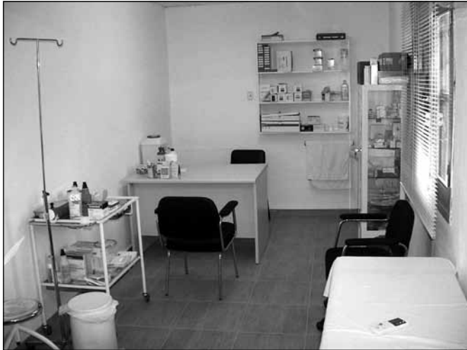
Fig. 3. Aspecto de una consulta de enfermería. (Para una mejor apreciación, consultar esta foto en color en el atlas fotográfico que encontrará al final del manual).

ocurren entre las 15 y las 8 horas (siempre y cuando el centro tenga servicio de urgencias), del día siguiente serán atendidas en la propia sala o consulta habilitada para el tratamiento de las urgencias por el personal sanitario que esté de guardia previa planificación de turno por la dirección del centro. También se puede acudir de forma ordinaria bajo previa cita solicitada al servicio de centralita o admisión del propio centro. La cita se puede solicitar normalmente por teléfono o de forma personal en presencia física en el propio centro.