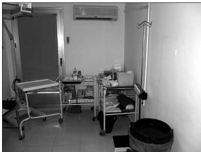
Fig. 4. Sala de inyectables y curas.

Se llevarán a cabo las curas de los pacientes en la misma sala que los inyectables normalmente. Se curarán las heridas de los pacientes que han sufrido quemaduras, accidentes, erosiones, caídas... según los criterios médicos y enfermeros (fig. 4). También se curarán las heridas de los pacientes que han sido intervenidos en hospital y que han sido dados de alta en el hospital y pasan a ser curados de forma ambulatoria por el personal de enfermería del centro de salud. Así pues se manifiesta la complementariedad entre la atención primaria y hospitalaria. El enfermero se encargará de volver a citar al paciente en función del estado de la herida para el seguimiento correcto. El personal Auxiliar de Enfermería se encargará de participar de forma activa en colaborar con el enfermero si éste lo precisa en la realización de la cura así como de la limpieza, colocación del material de las curas y reposición o colocación del material que es utilizado en la cura.