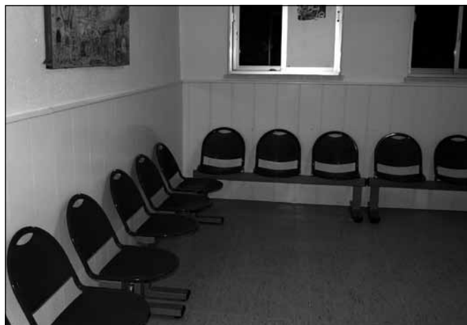
Fig. 6. Aspecto de una sala de espera.

(Para una mejor apreciación, consultar esta foto en color en el atlas fotográfico que encontrará al final del manual).