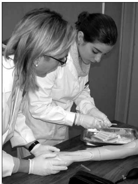
Fig. 5. Sala de extracciones de un centro de salud. (Para una mejor apreciación, consultar esta foto en color en el atlas fotográfico que encontrará al final del manual).

se reflejan las pruebas demandadas, identificación del médico, paciente y el mismo código que los tubos. Serán introducidos en una nevera para su conservación y serán transportados por el celador conductor del centro de salud hasta el laboratorio del hospital de referencia donde serán analizados.