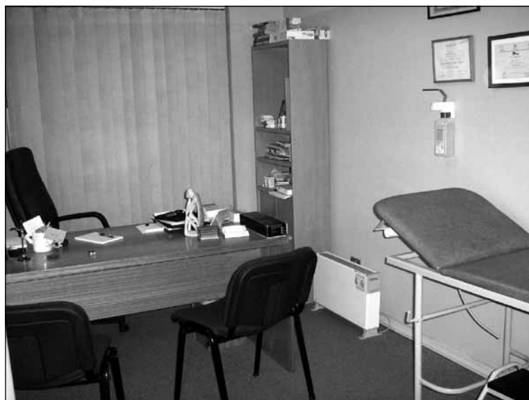
Fig. 2. Aspecto de una consulta médica. (Para una mejor apreciación, consultar esta foto en color en el atlas fotográfico que encontrará al final del manual).

Otra zona a destacar sería las consultas del centro, tanto médicas como de enfermería (fig. 2 y 3). El número de consultas suele ir acorde con el de médicos y personal de enfermería.