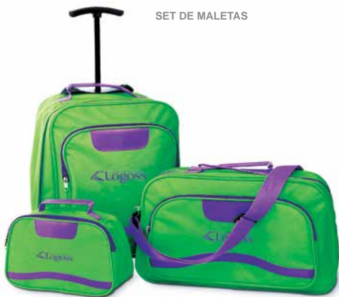
SET DE MALETAS